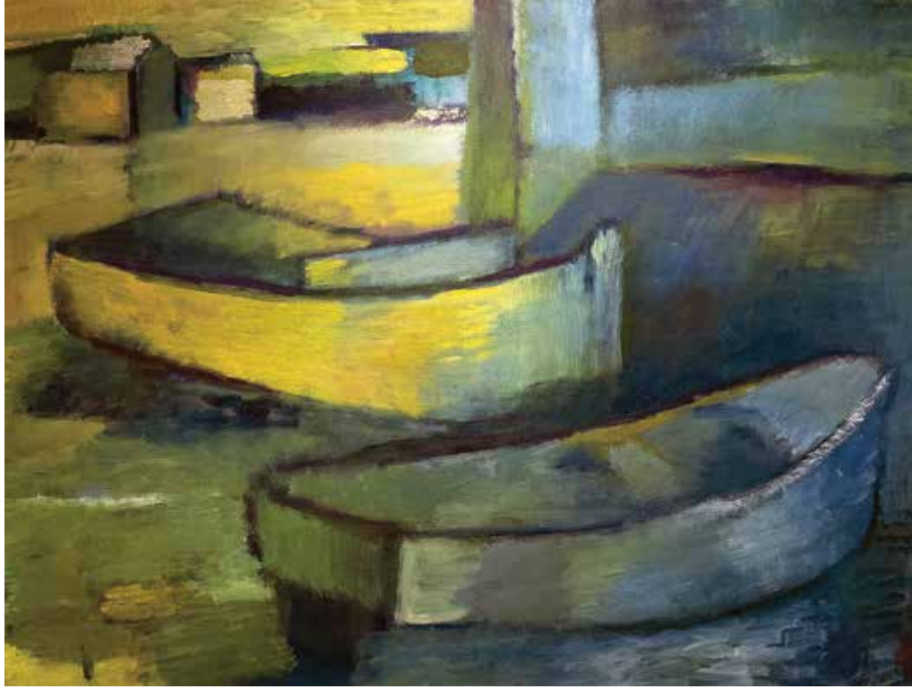
La propuesta pictórica de Tomás Gómez Robledo se ubica en la frontera entre lo abstracto y lo figurativo. La exposición Clasik se presenta en la Galería 526 del Seminario de Cultura Mexicana.

EL ARTISTA PLÁSTICO mexicano exhibe Clasik , que reúne 39 obras recientes sobre el desnudo, la naturaleza muerta y el paisaje