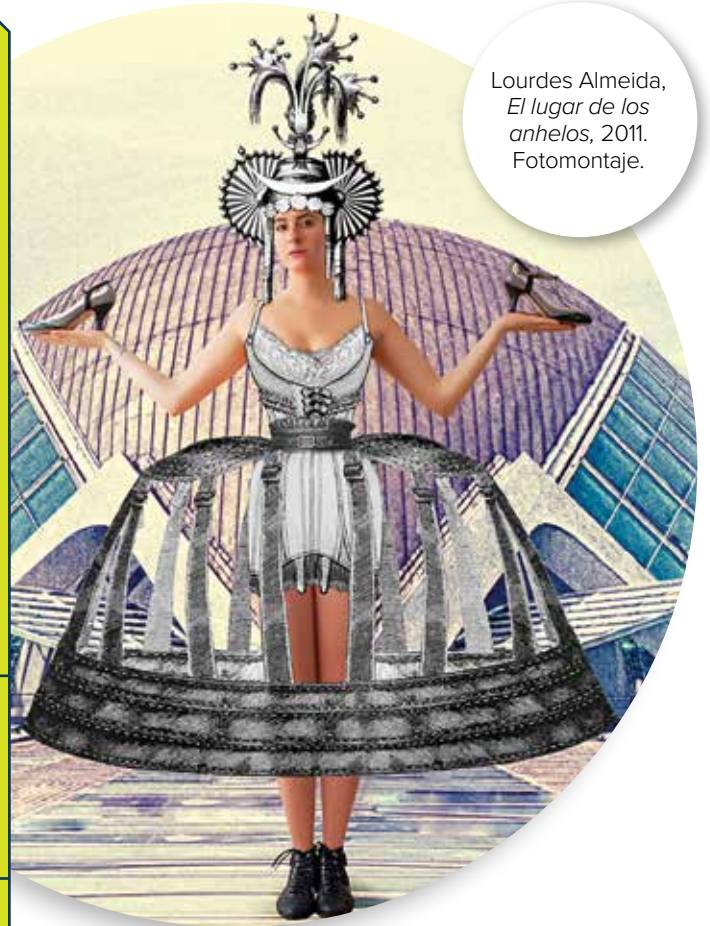
Lourdes Almeida, El lugar de los anhelos , 2011. Fotomontaje.

temáticas las vinculan. “Para Carmona, la obra de arte en sí es una forma de acceder al conocimiento, porque se convierte y se reviste de una memoria sensible, racional, creativa, capaz de trascender en el tiempo; que nos permite ver al creador en ese momento. Ella echa luz sobre distintos avances y transformaciones culturales, y sobre el futuro de la humanidad”.