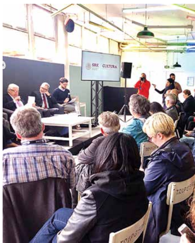
En la reunión, se destacó la importancia de la cultura en la relación entre México y Francia.

De esta manera, el Festival Lille3000, que este año está dedicado a México, contiene una serie de exposiciones