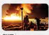
Señaló el Presidente López Obrador que se logró reducir el robo de combustible.

Se logró reducir el robo de combustible de un equivalente de mil 200. El presidente de la Comisión de Derechos Humanos del Estado de Hidalgo, Alejandro Habib Nicolás, informó que aún se tiene pendiente identificar 52 restos de víctimas cuyos cuerpos se carbonizaron durante la explosión de la toma clandestina de Tlahuelilpan, el 18 de enero. El ombudsman estatal explicó que inicialmente se contaba con 68 restos por identificar, de los cuales 16 ya fueron entregados a sus familiares.