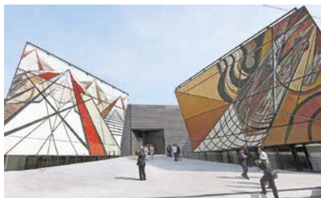
La Tallera, en Cuernavaca, exhibe desde hoy la exposición Todos los siglos son un instante .

La Troupe es un referente en la escena mexicana, 37 años de trayectoria hablan de permanencia y solidez.