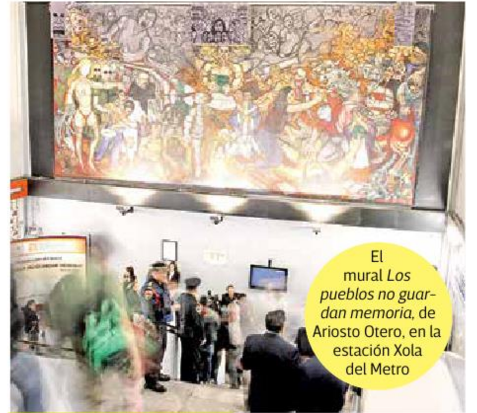
El mural Los pueblos no guardan memoria , de Ariosto Otero, en la estación Xola del Metro

También se refirió al comité seleccionador y a la participación de Unesco: