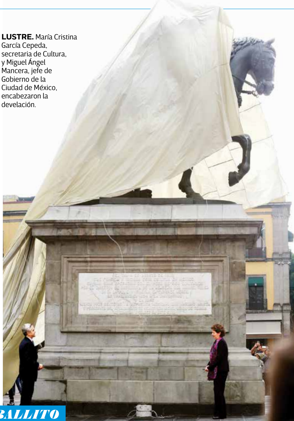
LUSTRE. María Cristina García Cepeda, secretaria de Cultura, y Miguel Ángel Mancera, jefe de Gobierno de la Ciudad de México, encabezaron la develación.