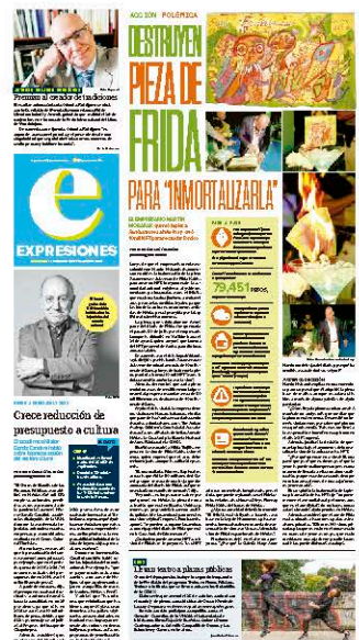
Excelsior publicó esta semana la polémica acción de Mobarak.