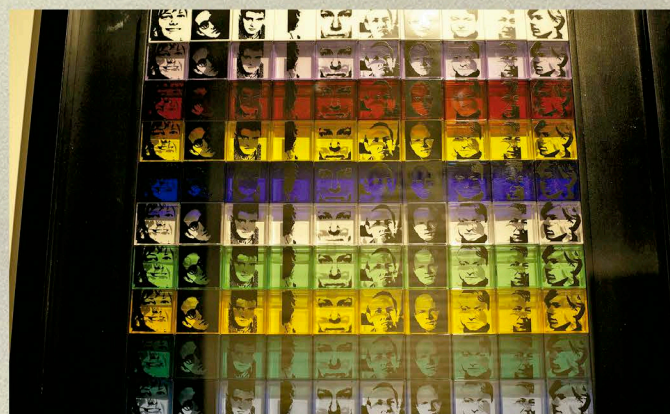
La serigrafía Portraits of the Artists , de Andy Warhol, fue el primer lanzamiento de CUBIC. Anoche estaba exhibida.