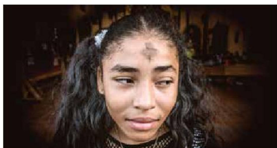
Las mujeres no sólo cuidan sus vidas, sino las de su comunidad.

Preguntas Cuando Maya Goded encuentra un tema que le interesa llega con muchas preguntas y termina con más preguntas.