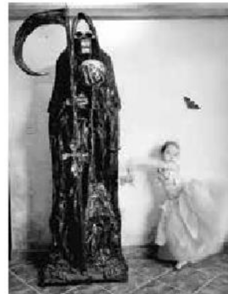
Niña baila con la Santa Muerte.

También habló sobre la fotografía. “Para mí, la fotografía es una investigación muy larga que va de la mano de mi vida. Siento que el arte es vivir todos los días y una extensión es la fotografía.”