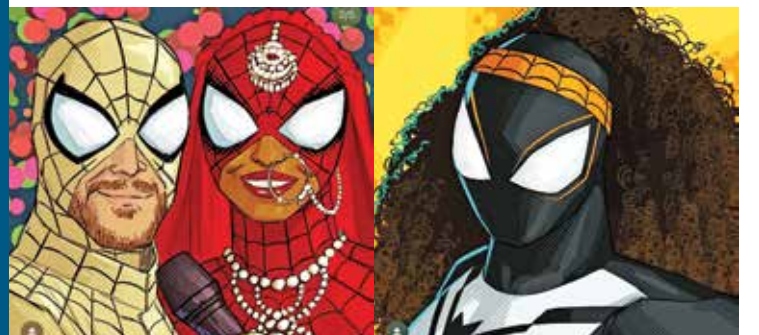
Nick Jonas y Priyanka Chopra.