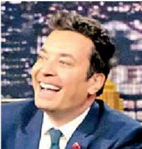
Stevie Wonder, Andrea Bocelli, Maluma, entre otros, serán parte de los invitados al concierto. Jimmy Fallon será uno de los anfitriones.

están ocurriendo a todos. Queremos celebrar y destacar la comunidad global singular y bondadosa que está surgiendo en este momento. Segundo, queremos subrayar la gravedad de este movimiento histórico y cultural sin precedentes. Y finalmente, queremos celebrar e impulsar el poder del espíritu