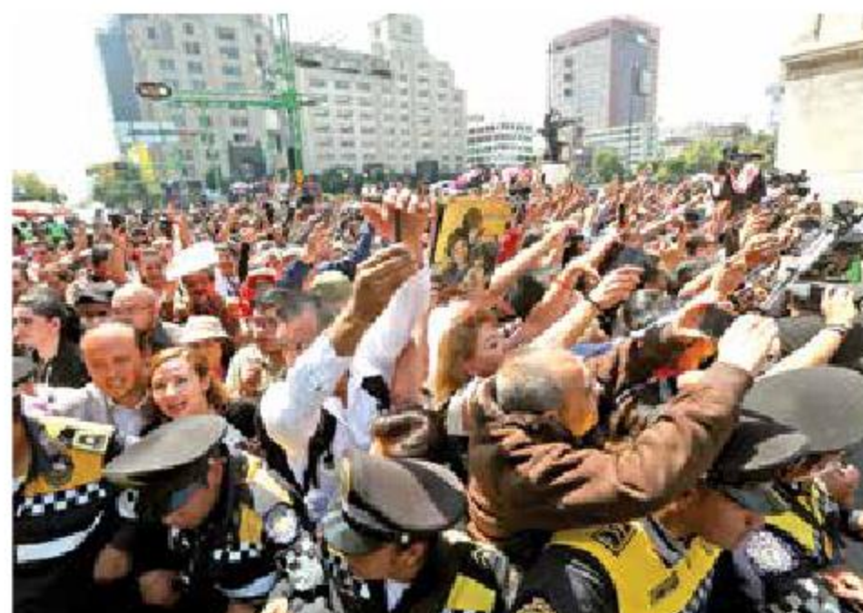
La gente esperó horas para entrar al recinto y despedirse del intérprete. Al final, cuando se cerraron las puertas se generó el caos.