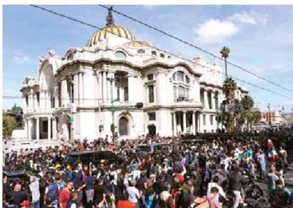
El cortejo fúnebre, proveniente del Aeropuerto de la Ciudad de México, llegó al Palacio de Bellas Artes entre cientos de seguidores.