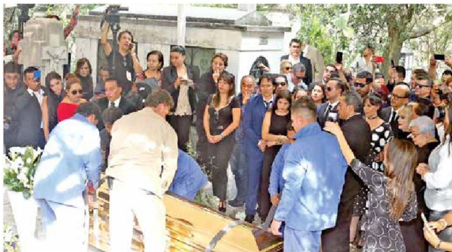
Seis hombres fueron los encargados de bajar el ataúd ante la mirada de familiares y amigos muy cercanos del cantante mientras sonaba la canción El Triste .

MIL PERSONAS se reunieron sobre Legaria, afuera del Panteón Francés, para dar el último adiós a José José