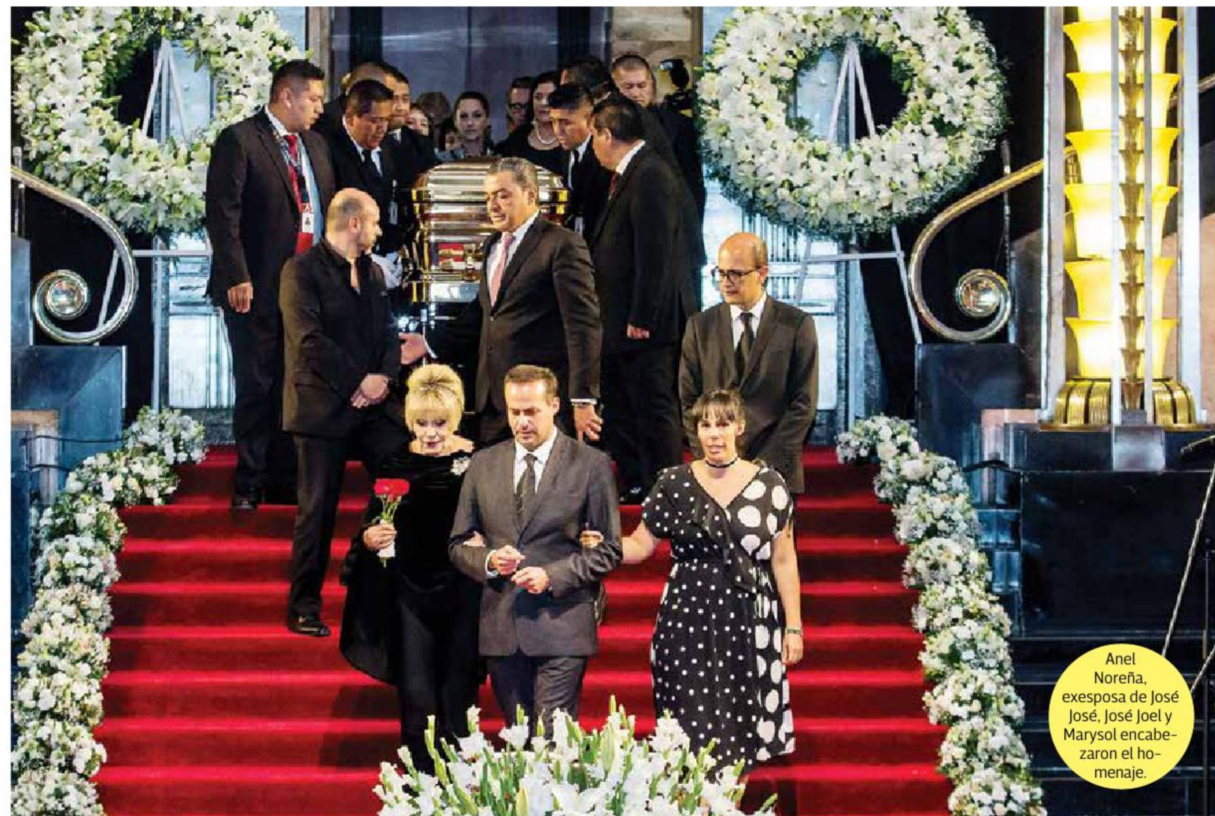
Anel Noreña, exesposa de José José, José Joel y Marysol encabezaron el homenaje.