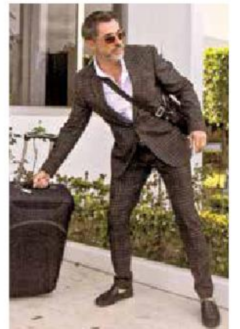
Sergio Mayer ayudó a facilitar el traslado de los restos.

Mayer, presidente de la Comisión de Cultura y Cinematografía de la Cámara de Diputados, señaló que el gobierno federal siempre fue respetuoso de las decisiones de la familia, y ésta es la parte importante de ese logro.