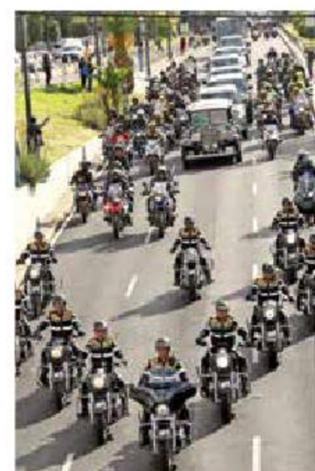
El ataúd fue escoltado durante todos sus recorridos.