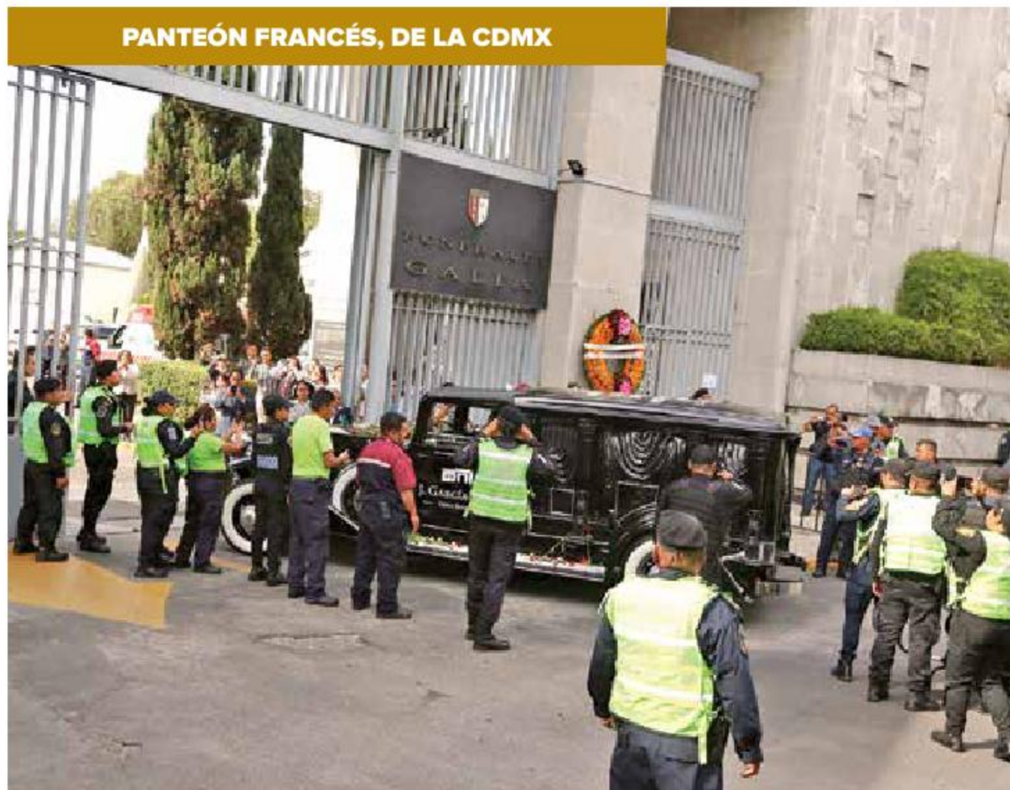
La carroza llegó alrededor de las 16:25 horas al Panteón Francés, en donde cientos de personas esperaban poder entrar, sin embargo, sólo les fue permitida a familiares y amigos cercanos.