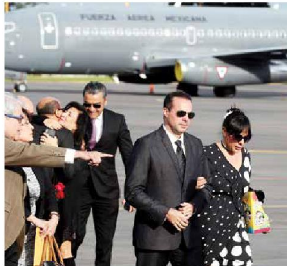
José Joel y Marysol viajaron con los restos del cantante en un avión de la Fuerza Aérea Mexicana.

"Hoy te digo, mi príncipe, mi Pepe: Espérame en el cielo corazón. Que mi corazón te has llevado. Ya no tengo lágrimas. Se han secado por tu partida. Siempre serás mi más grande amor. Más allá de la eternidad. Hoy te veré y me despidiré. Ya no habrá ningún impedimento para amarnos más. Sabes bien que éramos el uno para el otro... Espérame en el cielo", escribió Anel Noreña en su cuenta de Instagram para despedirse de quien fuera su esposo.