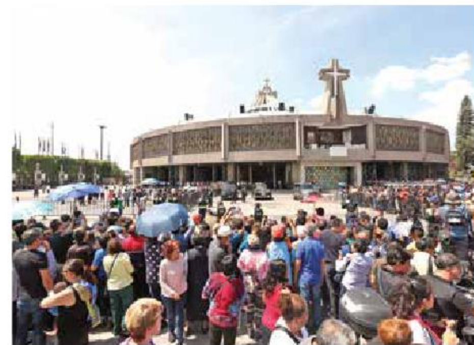
Cientos de seguidores de José José esperaron afuera de la Basílica de Guadalupe, bajo el sol, la llegada de los restos del intérprete.