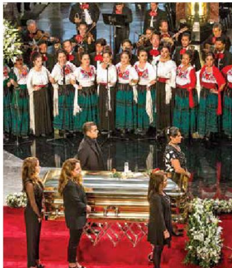
Ayer, los éxitos de José José se escucharon, interpretados por cuartetos, orquesta sinfónica, mariachi y coros.