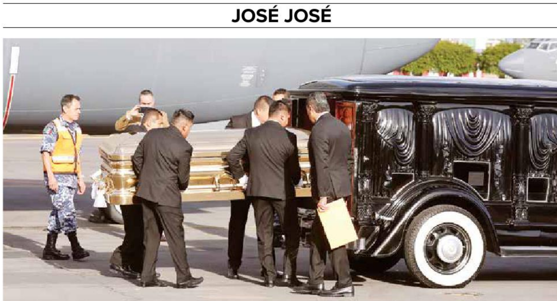
El ataúd de bronce con chapa de oro, con las cenizas de José José en su interior, fue subido a una carroza en la que recorrió la ciudad.