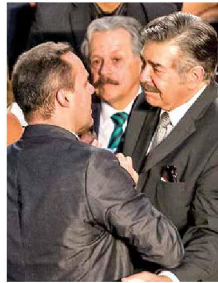
El actor Jorge Ortiz de Pinedo, amigo del cantante, montó una de las últimas guardias de honor.