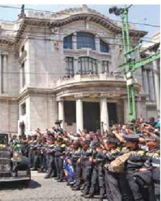
Se abrió el Palacio de Bellas Artes y se realizó una misa.