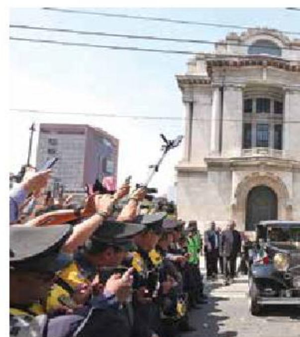
Después de las 13:00 horas, el cortejo fúnebre rumbo a la Basílica de Guadalupe, donde se