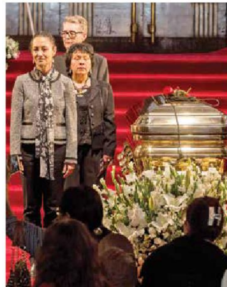
La jefa de Gobierno de la Ciudad de México, Claudia Sheinbaum, estuvo presente durante el acto.