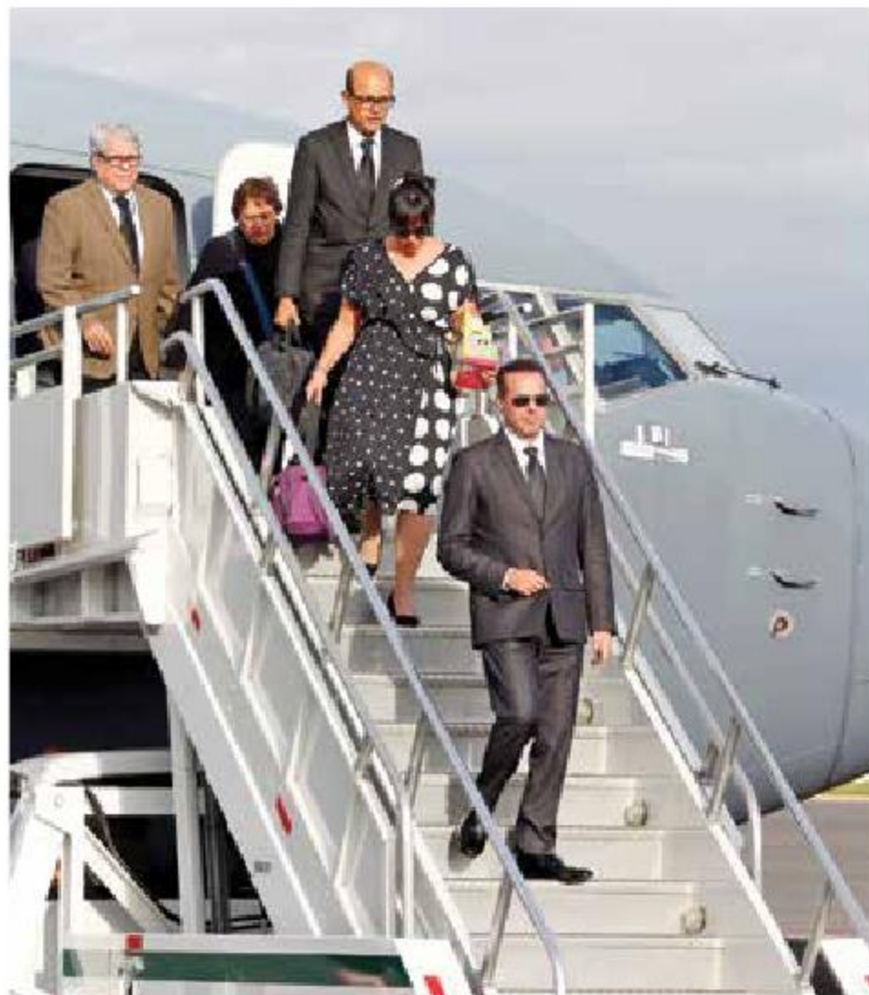
El avión que traía las cenizas de José José aterrizó a las 8:22 de la mañana.