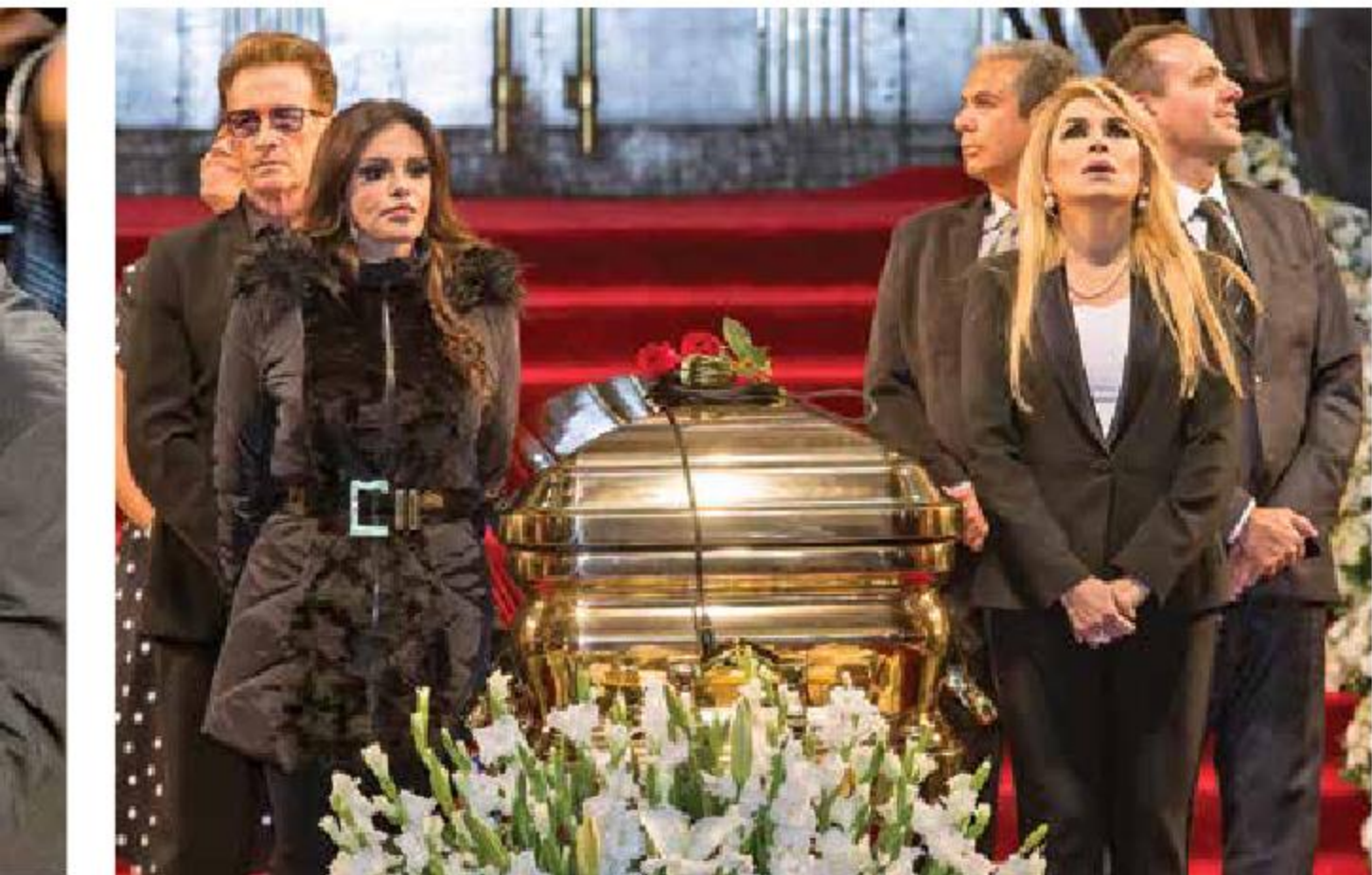
El cantante Emmanuel y las intérpretes Lucía Méndez y Dulce también rindieron tributo a El Príncipe de la Canción . Ambas fueron muy criticadas en redes por su afán de protagonismo.