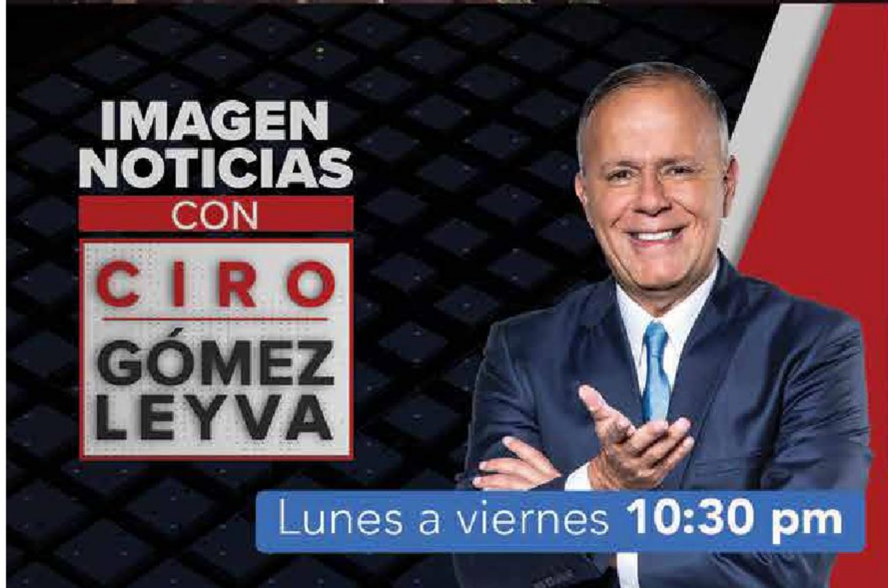
IMAGEN NOTICIAS CON CIRO GÓMEZ LEYVA