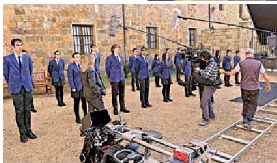
La serie de ficción pretende entretener en tiempos complicados como los que vive la humanidad actualmente.

El internado: Las Cumbres es un reboot de la serie El internado: Laguna negra (2007-2010) y se desarrolla en un edificio junto a un antiguo monasterio que está situado en un lugar inaccesible entre las montañas, completamente aislado.