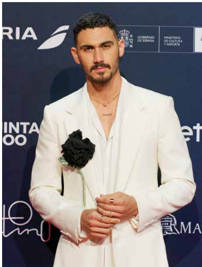
El actor dará vida a Carlos Armas, integrante de Locomía.

“A mí me encanta la idea de que no se encasillaron, que de pronto aparecieron con esos abanicos, con esas hombreras, a veces japoneses, a veces de traje y sin etiquetas, lo cual me parece fantástico. Locomía tiene que ver con