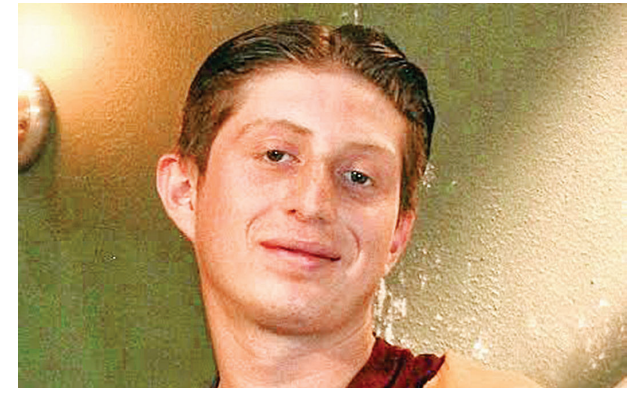
El actor Octavio Ocaña falleció el pasado 29 de octubre en una persecución policiaca.

Su última participación como director fue en la telenovela Sueño de amor , de 2016.