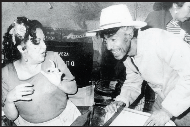
Bruno Bichir y Salma Hayek en la película El callejón de los milagros , que le dio a Jorge Fons el Ariel a Mejor Director en 1995.