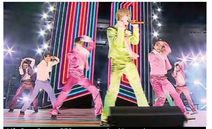
Life Goes On, con BTS, en una grabación previa.