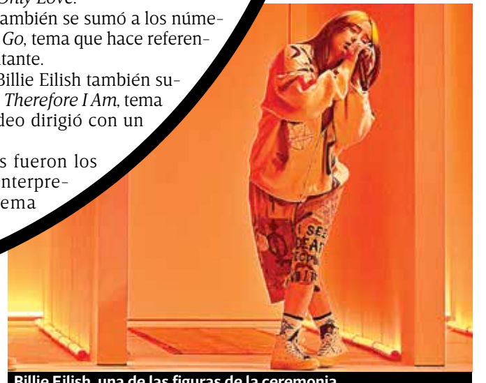
Billie Eilish, una de las figuras de la ceremonia.