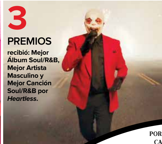
The Weeknd apareció caracterizado con la cara vendada.

recibió: Mejor Álbum Soul/R&B, Mejor Artista Masculino y Mejor Canción Soul/R&B por Heartless .