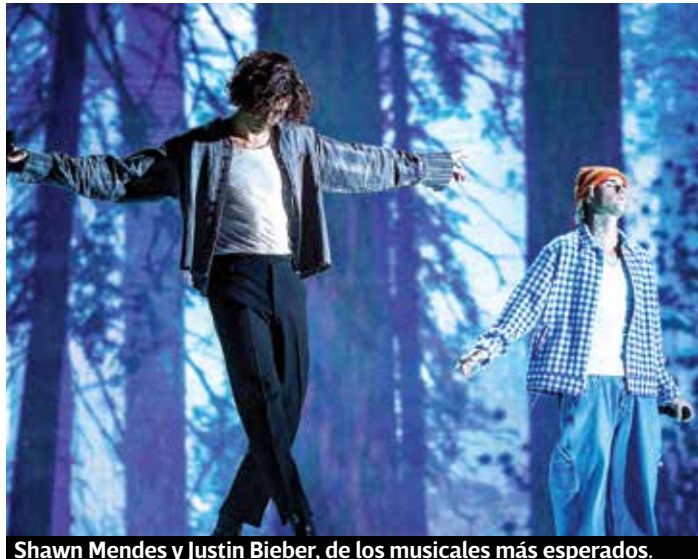
Shawn Mendes y Justin Bieber, de los musicales más esperados.