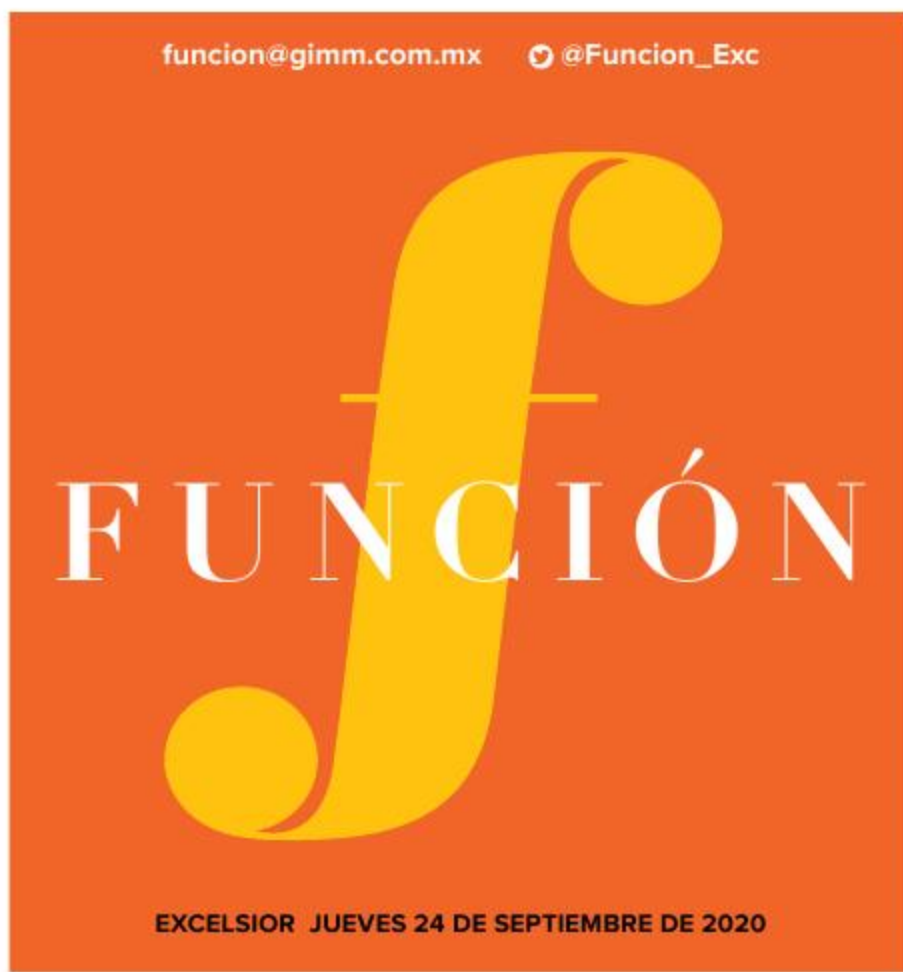
EXCELSIOR JUEVES 24 DE SEPTIEMBRE DE 2020