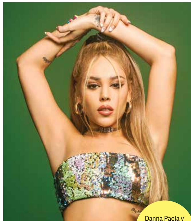
Danna Paola y La Bala están nominadas como Artista Mexicano.