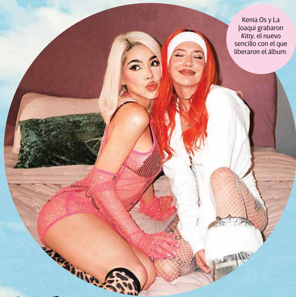
Kenia Os y La Joaqui grabaron Kitty , el nuevo sencillo con el que liberaron el álbum.