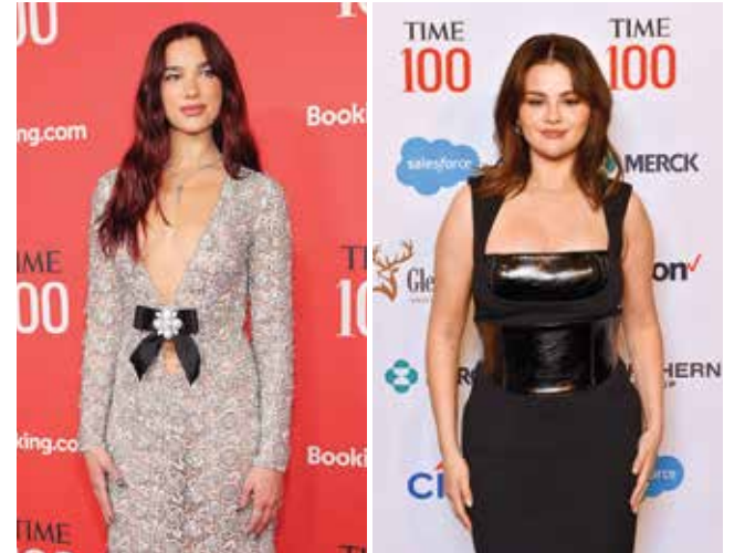
DUA LIPA Y SELENA GOMEZ