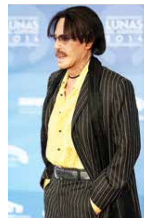
Mantuvo alta la audiencia de su programa de radio.