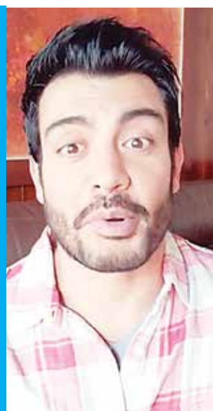
— De la Redacción

Debido a que los actores Andrés Palacios y Alejandro Camacho dieron positivo a covid-19, además de dos personas de producción, la telenovela Imperio de Mentiras detuvo sus grabaciones. La decisión se tomó para proteger al resto del equipo de la producción que actualmente se transmite.