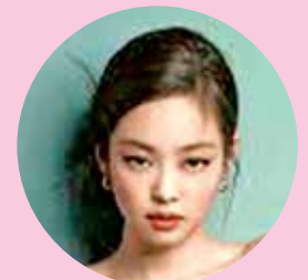
JENNIE 27 AÑOS ORIGINARIA DE COREA DEL SUR

"Probamos la fruta con chile y estamos encantadas", compartió Jennie a su público que recibió el anuncio con el mejor humor antes de que las chicas atacaran a sus seguidores con DDU-DU DDU-DU y Forever Young con la cual se despidieron solo para regresar minutos después a cerrar el primero de dos shows en México, sin dejar de portar unos sombreros de charro y yomarse una selfie sobre el escenario.