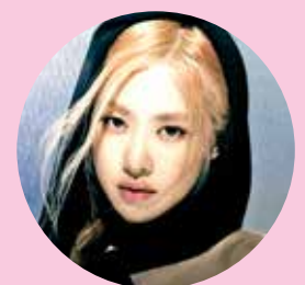
ROSÉ 26 AÑOS ORIGINARIA DE AUCKLAND, NUEVA ZELANDA