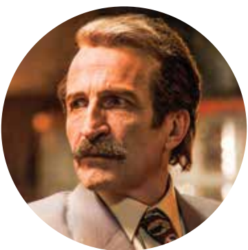
Daniel Giménez Cacho.