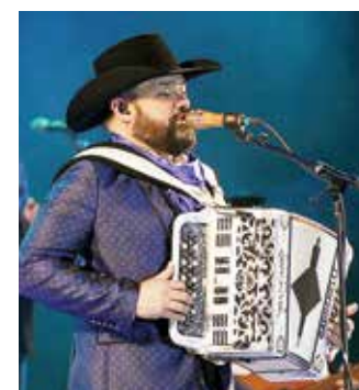
El grupo Intocable.

Según lo explicado por los organizadores, los automóviles se estacionarán, respetando una distancia de un cajón de estacionamiento,