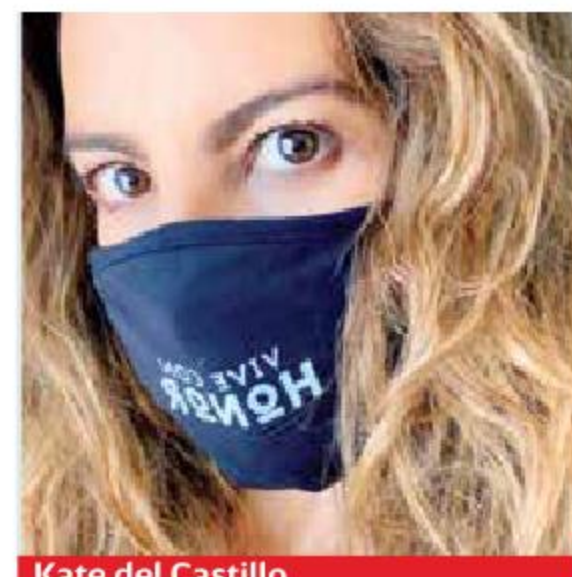
Kate del Castillo.