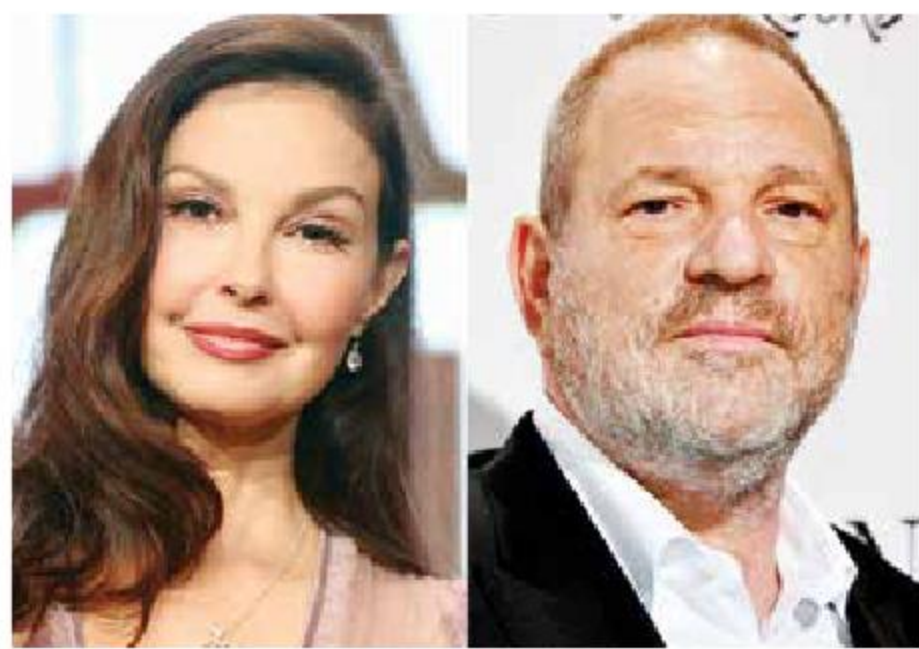
Ashley Judd dijo que Weinstein obstaculizó su carrera.