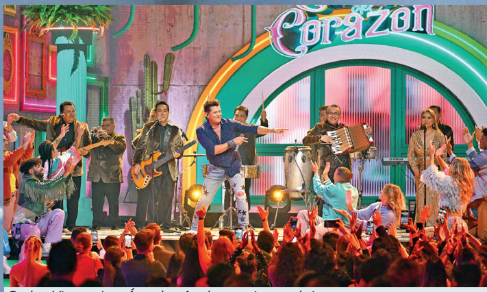
Carlos Vives y Los Ángeles Azules pusieron el ritmo.