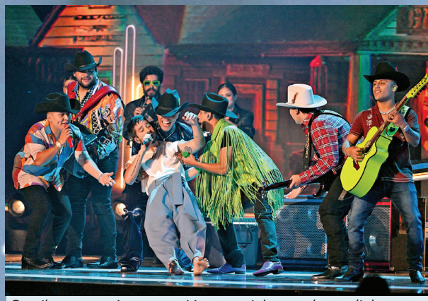
Camilo presentó una canción especial para el mundial.