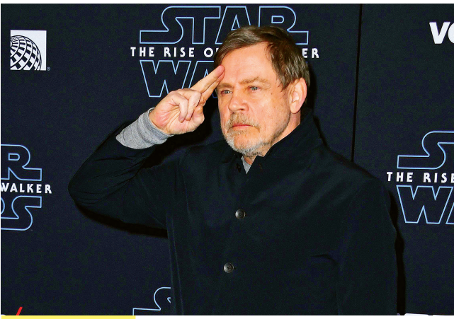
MARK HAMILL