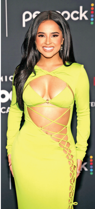
Becky G cautivó a los presentes con su atuendo.

Con una versión especial de Aeropuerto , especialmente pensada para la Copa del Mundo de Qatar 2022, Camilo puso a bailar a los presentes de la velada con la cual se cerró esta edición de los premios a la música latina.