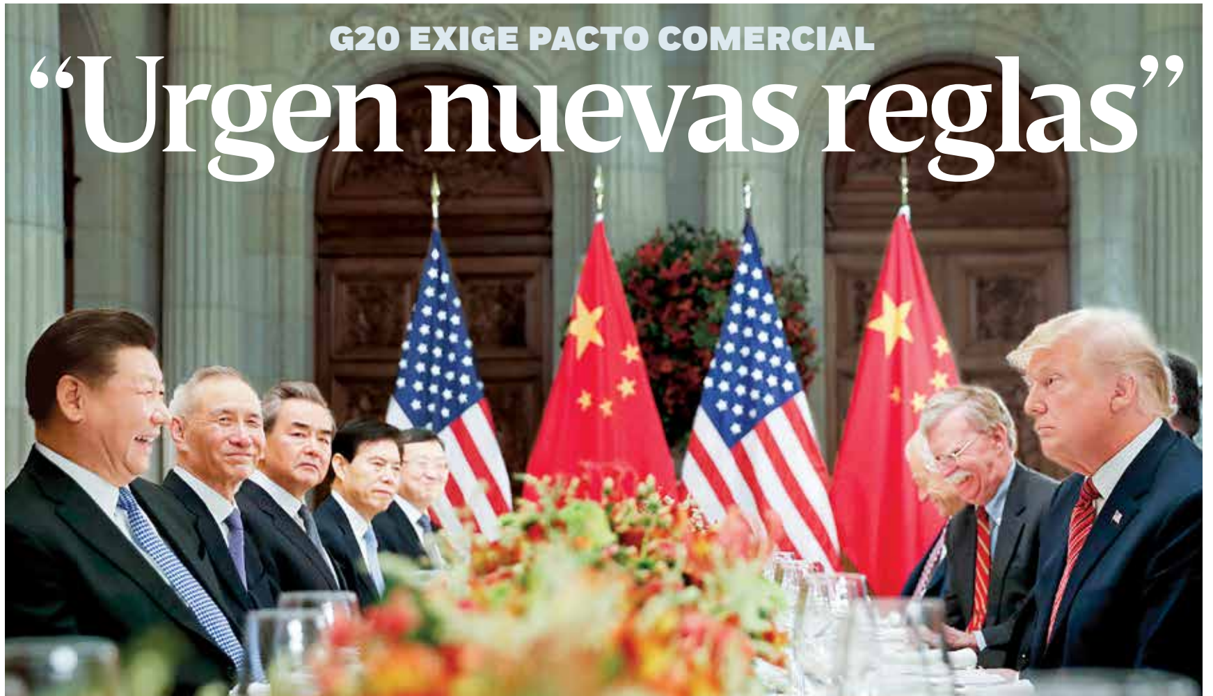
El presidente Donald Trump se reunió con su homólogo Xi Jinping (izq.) para abordar temas comerciales, durante la cumbre del Grupo de los 20, ayer en Buenos Aires.