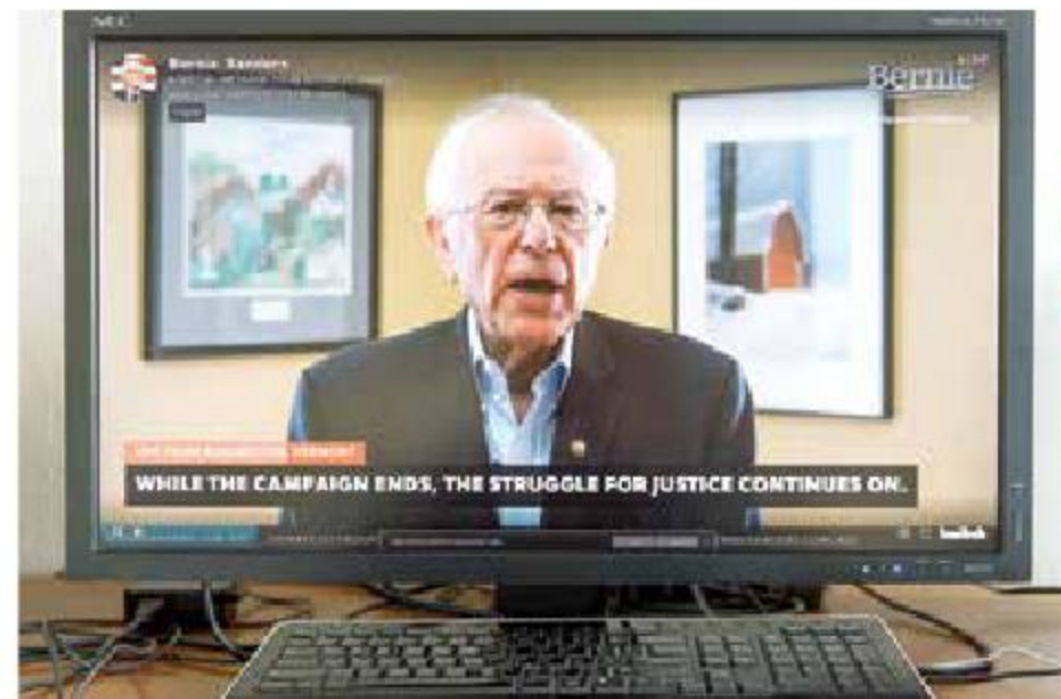
En un mensaje por internet, Bernie Sanders llamó a sus seguidores a respaldarlo para defender sus ideales en la convención demócrata.