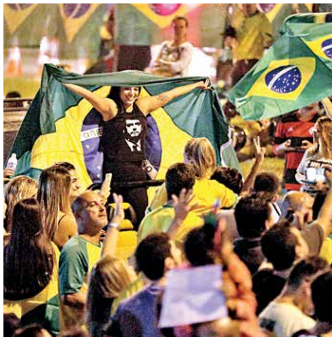
Simpatizantes del candidato presidencial Jair Bolsonaro celebraron en Río de Janeiro su victoria en la primera vuelta de la elección.

El Partido Social Liberal, que postuló al ultraderechista a la Presidencia, elevó el número de sus diputados de 8 a 52