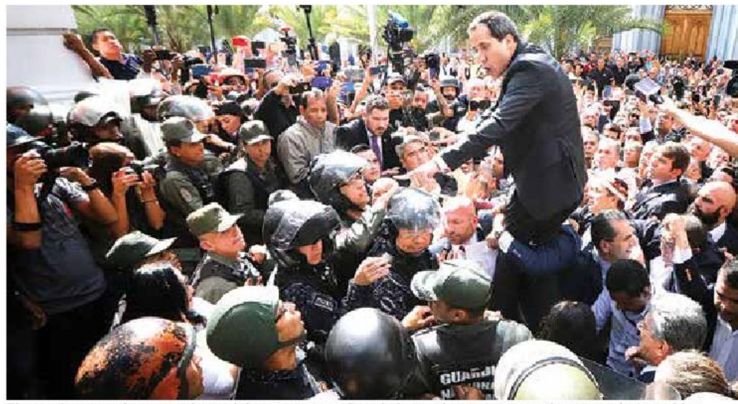
El pasado miércoles, seguidores del opositor Juan Guaidó lo ayudaron a vencer el cerco en la Asamblea.

A pesar de la abrumadora condena de las acciones