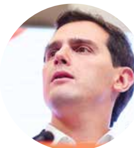
ALBERT RIVERA EXLÍDER DE CIUDADANOS