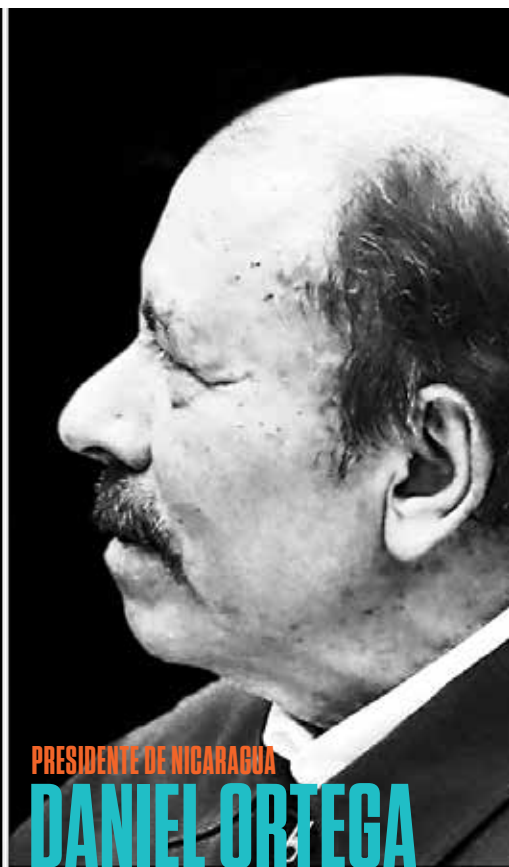
PRESIDENTE DE NICARAGUA DANIEL ORTEGA

Es una cosa que está fuera de lo que estamos viviendo, es como si fuera a traer la dictadura comunista de 1917 o la hitleriana del 35, traer aquí las mismas. Son un tipo de dictaduras groseras.