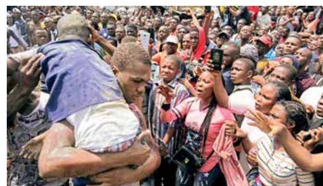
Personal de emergencias, bomberos y rescatistas lograron sacar con vida a algunos menores del inmueble dañado en Lagos.

El barrio de Lagos Island, popular y densamente poblado, es uno de los más viejos de la ciudad, en la que habitan unos 20 millones de personas.