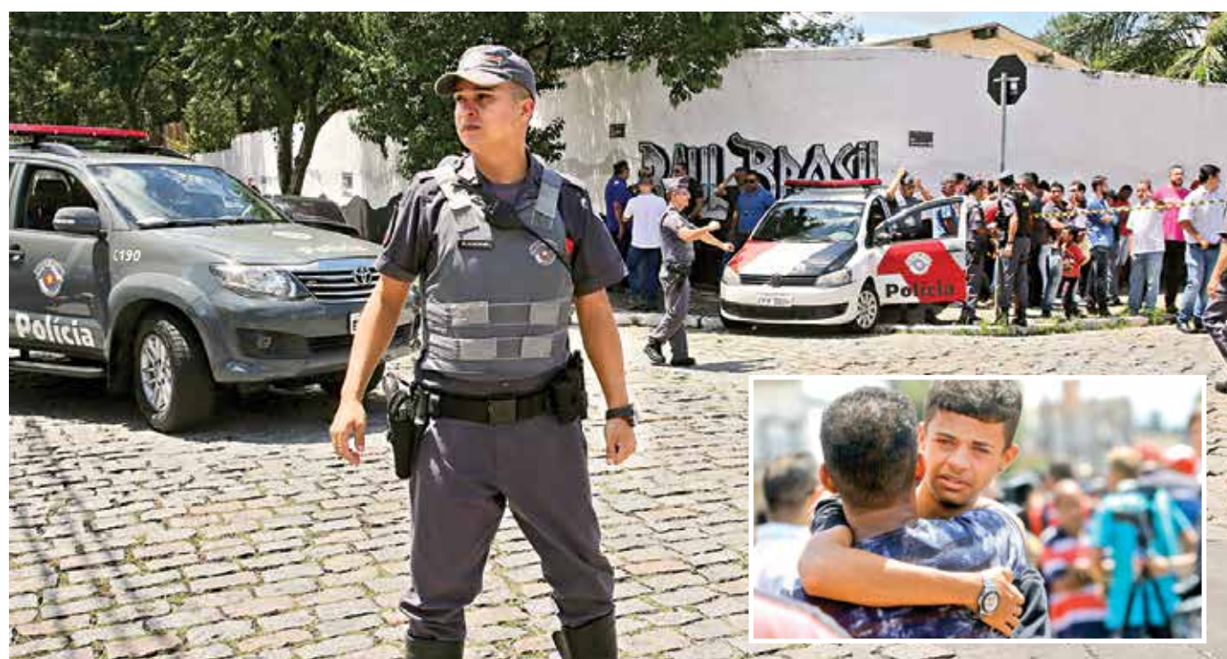
VIOLENTA TRAGEDIA. Policías, paramédicos y personal de seguridad atendieron a los lesionados de la escuela Raúl Brasil.