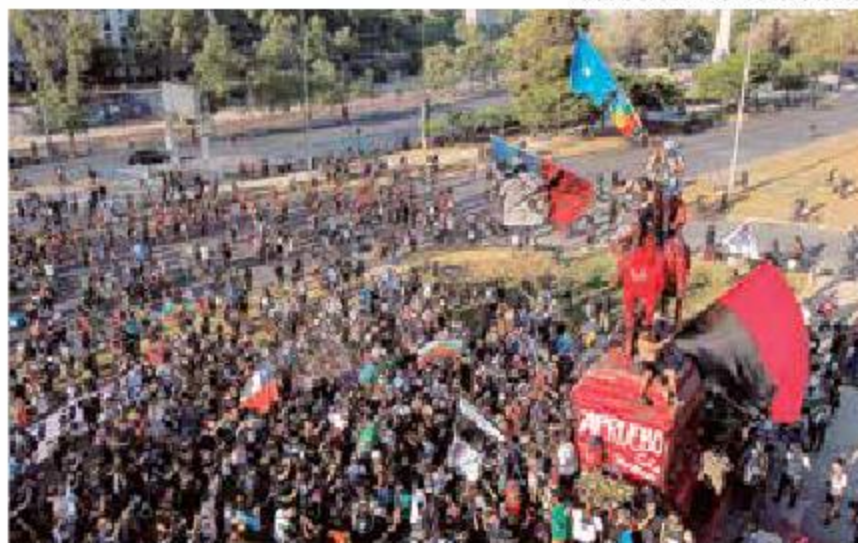
VANDALIZAN ESTATUA Protesta contra el gobierno de Sebastián Piñera alrededor del monumento al general Manuel Baquedano, pintado de rojo.