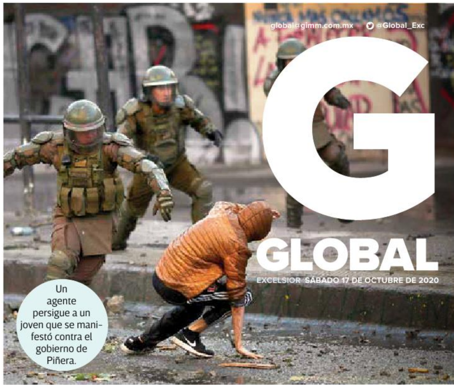
Un agente persigue a un joven que se manifestó contra el gobierno de Piñera.