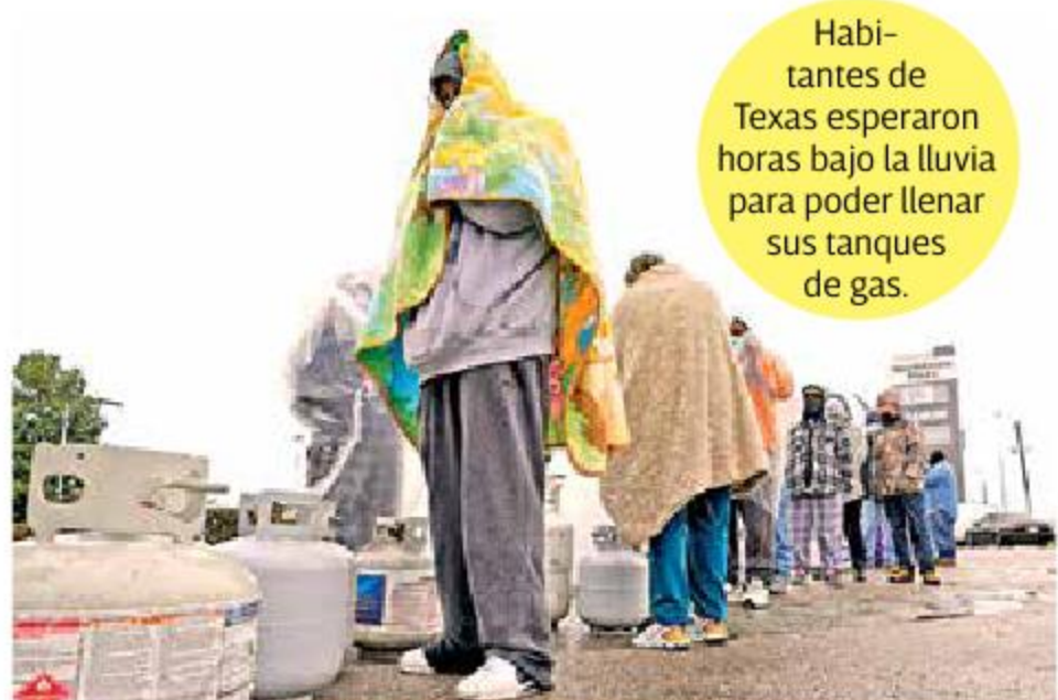
Habitantes de Texas esperaron horas bajo la lluvia para poder llenar sus tanques de gas.

El NWS indicó que la tormenta, en su avance hacia el noreste, llevaba hielo, aguanieve y nieve intensa a