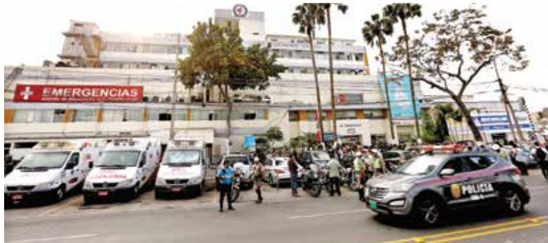
Simpatizantes de Alan García afuera del Hospital de Emergencia Casimiro Ulloa.