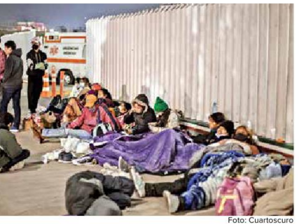
Decenas de personas durmieron frente a las instalaciones del Instituto Nacional de Migración, en el puerto fronterizo El Chaparral.