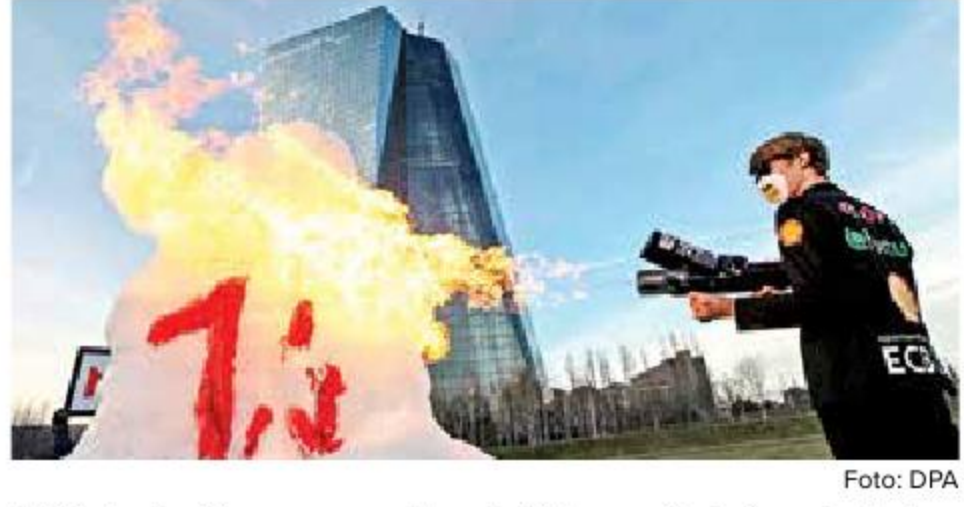
Activistas derritieron una escultura de hielo para simbolizar el calentamiento global, durante una protesta frente al Banco Central Europeo.

Este reingreso significa que el Acuerdo de París nuevamente incluye