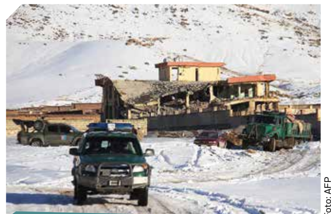
CASI 100 MUERTOS