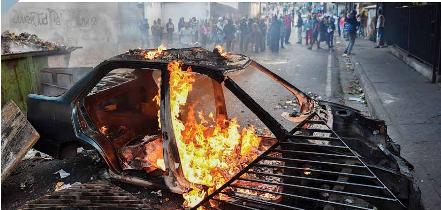
INTENSA JORNADA. Automóviles fueron incendiados, ciudadanos se enfrentaron con la policía y resultaron heridos en las protestas de ayer.