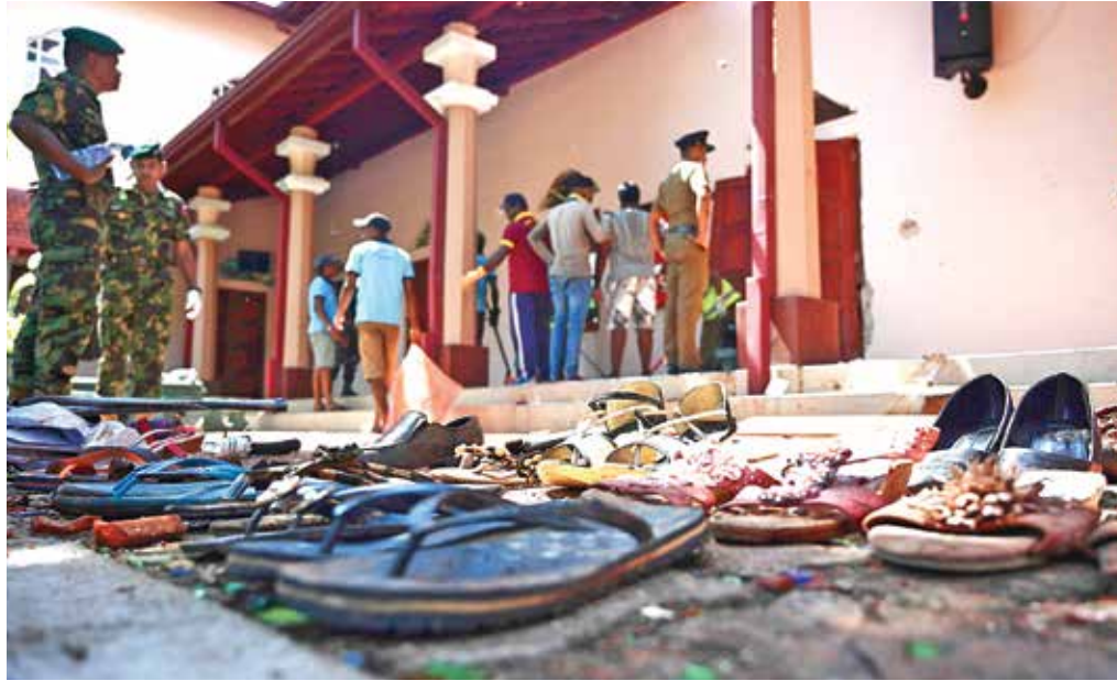
BUSCAN PISTAS. Policías mantienen decenas de zapatos como evidencias en la Iglesia de Negombo.