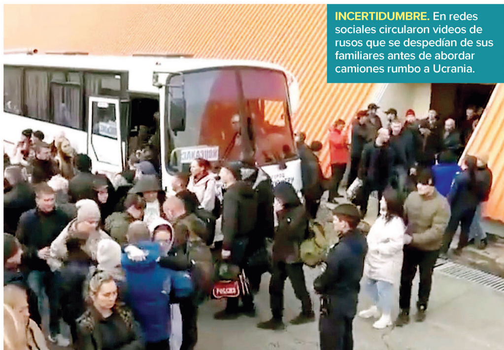
INCERTIDUMBRE. En redes sociales circularon videos de rusos que se despedían de sus familiares antes de abordar camiones rumbo a Ucrania.