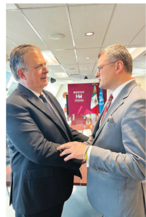
El canciller Marcelo Ebrard se reunió con su homólogo ucraniano, Dmytró Kuleba.