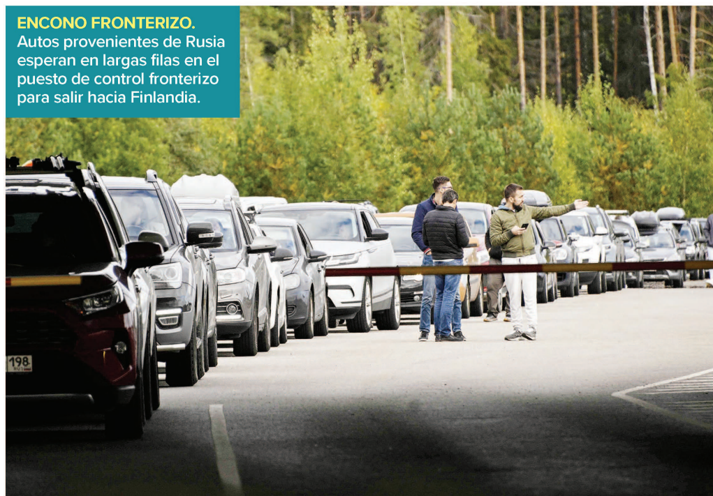
ENCONO FRONTERIZO. Autos provenientes de Rusia esperan en largas filas en el puesto de control fronterizo para salir hacia Finlandia.