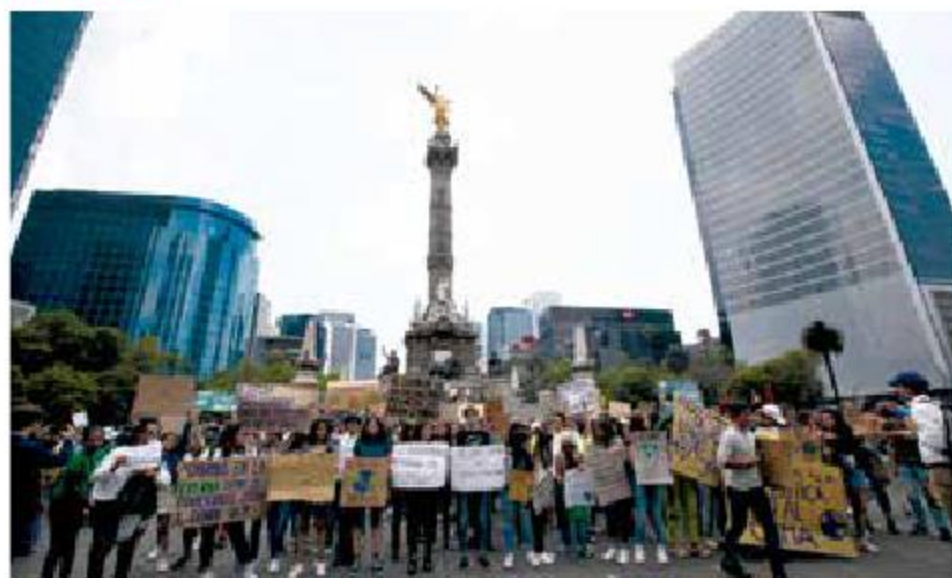
En la Ciudad de México también se sumaron a la manifestación.