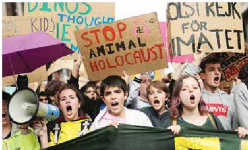
Adolescentes se movilizaron en Barcelona y otras ciudades españolas.