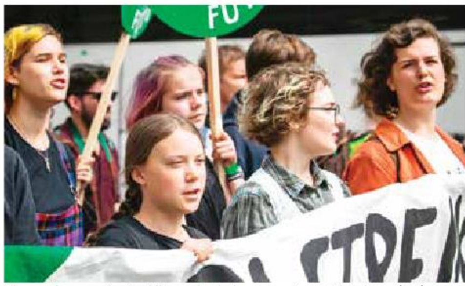
El mundo reaccionó al llamado de la sueca Greta Thunberg (izq).