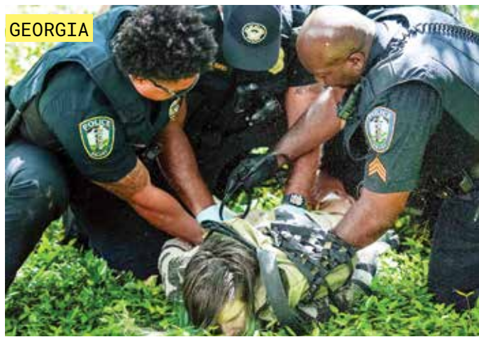
GEORGIA Tres uniformados sometieron a un estudiante en la ciudad de Atlanta, Georgia.