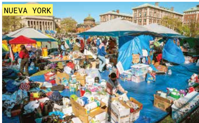
NUEVA YORK Los manifestantes mantienen el campamento y empiezan a recolectar insumos.