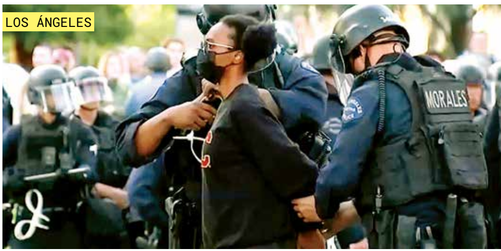
LOS ÁNGELES En la Universidad del Sur de California, ubicada en Los Ángeles, policías arrestaron a 93 personas por invasión a la propiedad privada.

Sánchez anunciará el lunes si se mantiene en el cargo.