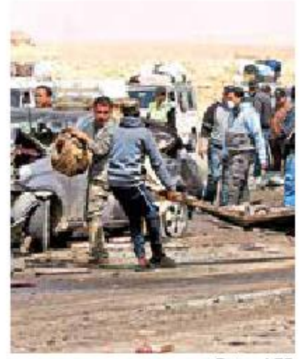
Camión arrolla varios vehículos; hay 18 muertos

EL CAIRO.— Al menos 18 personas murieron ayer después de que un camión arrolló varios vehículos que estaban detenidos en un puesto de control cerca de la capital de Egipto, El Cairo, por la pandemia de coronavirus.