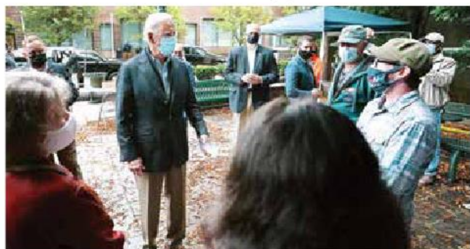
El candidato demócrata, Joe Biden, se reunió con voluntarios de su campaña en la ciudad de Chester, Pensilvania.

Esta semana los candidatos se enfocan en cinco entidades; encuestas dan ligera ventaja a Biden