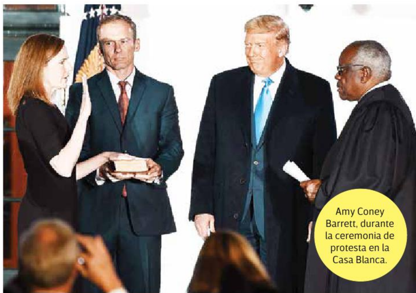
Amy Coney Barrett, durante la ceremonia de protesta en la Casa Blanca.