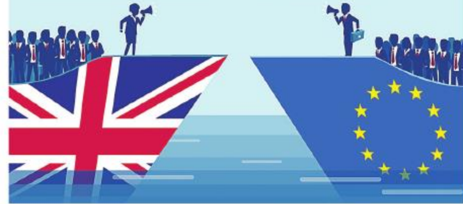
Ilustración: Parlamento Europeo

Los debates se extendieron por cinco horas y dieron lugar a una votación secreta mediante voto electrónico.