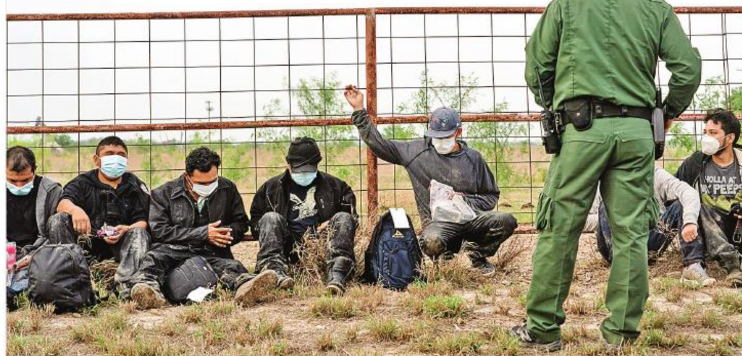
DETENIDOS TRAS PASAR EL RÍO BRAVO Migrantes centroamericanos esperan en La Joya, Texas, ser transportados por la Patrulla Fronteriza.