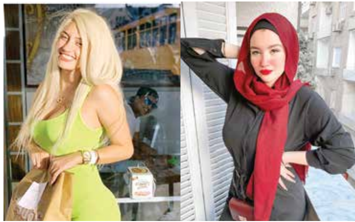
Foto: Tomadas de Instagram @mawada_al_adham_style @haneenhossamofficial. Las mujeres fueron señaladas de conductas que atentan contra la moral; en total, cinco influencers se encuentran encarceladas.

mayo, se encuentran entre una decena de mujeres populares en las redes, blanco de las autoridades en los últimos meses.