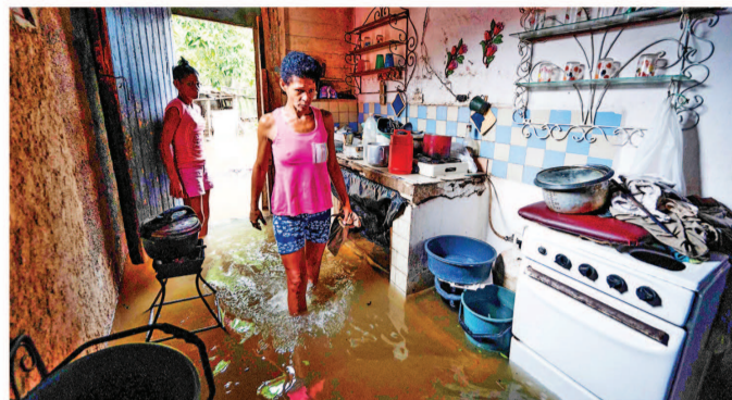
Una familia observa su hogar inundado en el municipio de Batambó, en el sur de Cuba.

En tanto, el Centro Nacional de Huracanes de Estados Unidos (NHC) anunció que el fenómeno meteorológico alcanzó vientos máximos sostenidos de 205 kilómetros por hora.