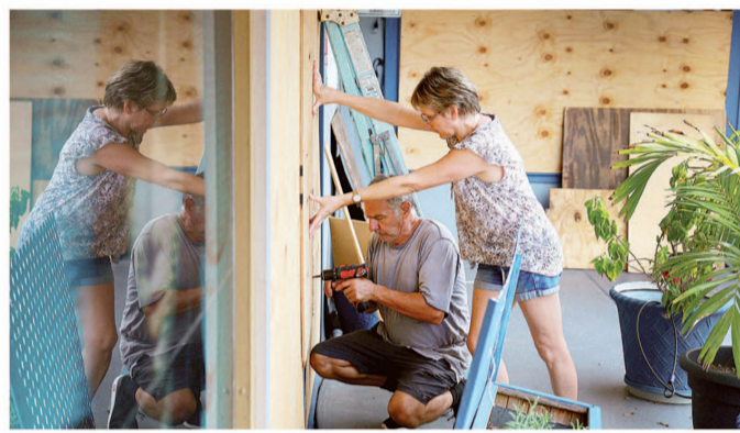
En el área de Tampa Bay, en Florida, decenas de personas bloquean puertas y ventanas para prevenir afectaciones.