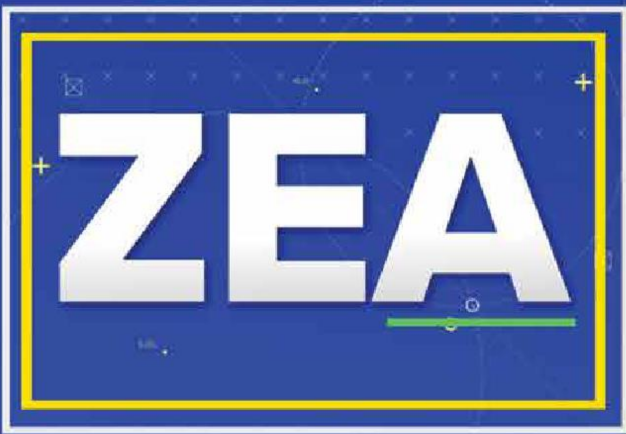
IMAGEN NOTICIAS CON FRANCISCO