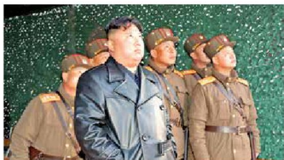
SUMAN SIETE ESTE MES