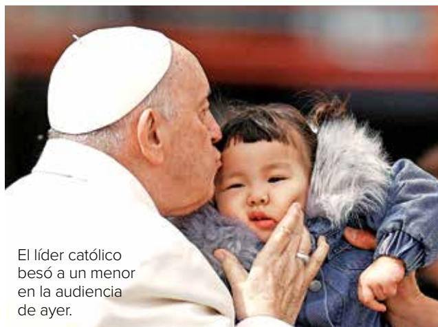
El líder católico besó a un menor en la audiencia de ayer.

Las audiencias de los próximos días fueron anuladas.