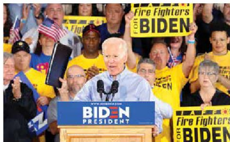
El precandidato demócrata, Joe Biden, durante un mitin en Pensilvania, ante unos 500 seguidores de clases trabajadoras.

La última encuesta publicada por ABC News y The Washington Post dan a Biden un 17 por ciento de intención de voto. Mientras que su principal rival partidario, Bernie Sanders, recibe un 11 por ciento.