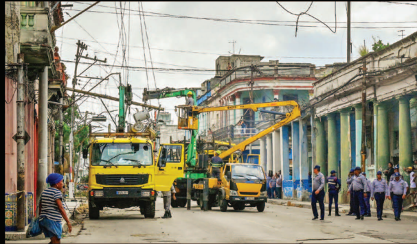
Trabajadores de la industria eléctrica asisten postes e instalaciones en el municipio de El Cerro.