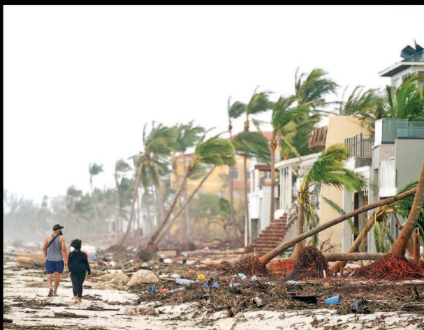
En Bonita Springs, Florida, dos personas observan los daños que dejó el huracán en la región.